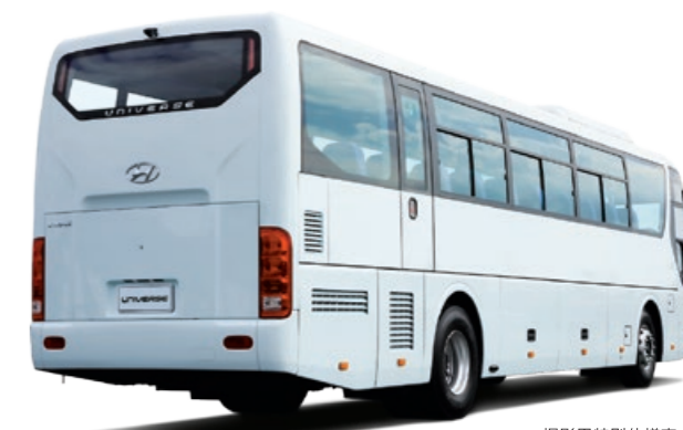
撮影用特別仕様車

衝突被害軽減ブレーキシステムや車線逸脱警報システム、車両安定装置に加えドライバー異常時対応システムを標準装備しています。また、全正座席には3点式ELRシートベルトを採用し、安心と安全を提供しています。