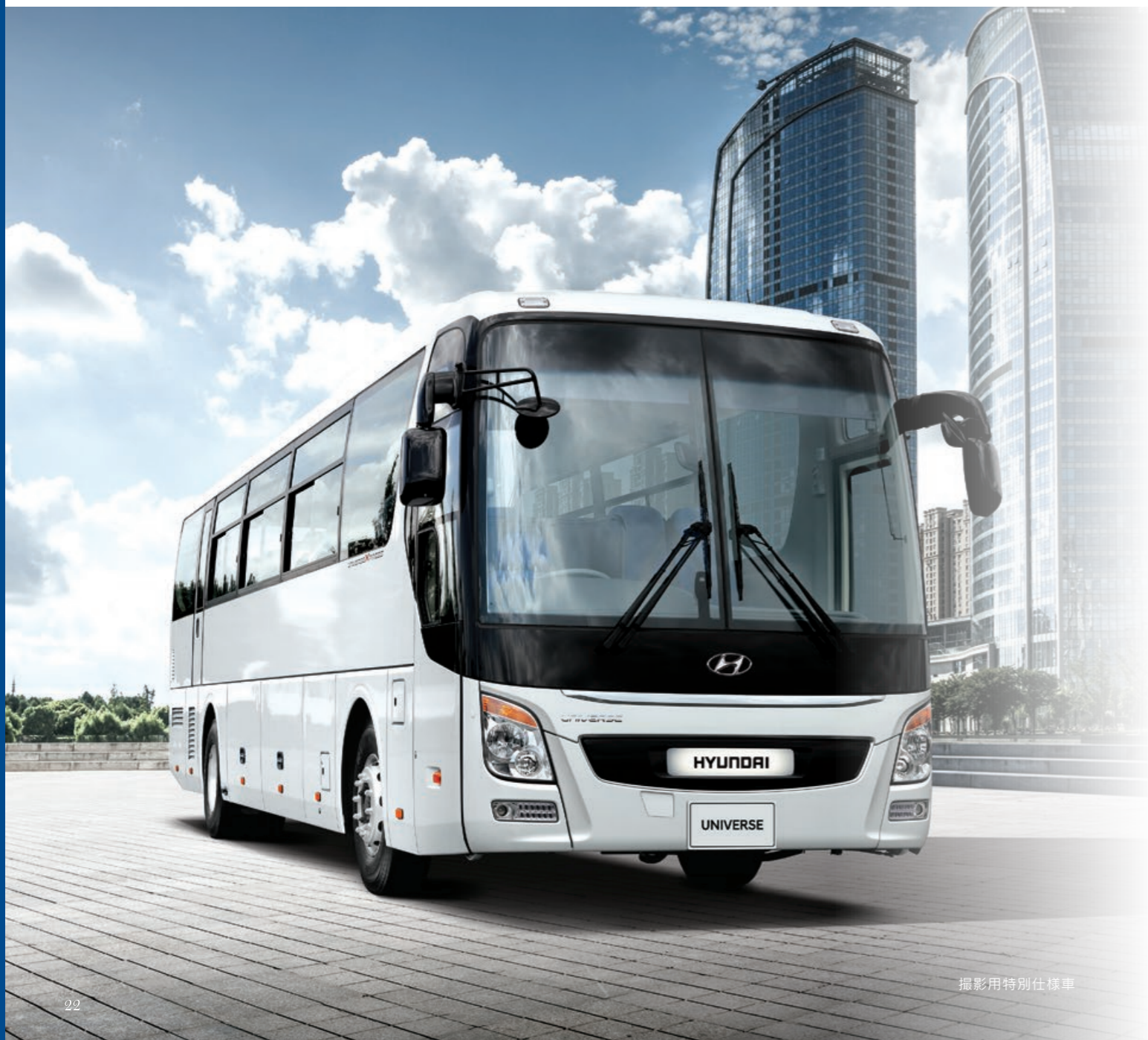
撮影用特別仕様車