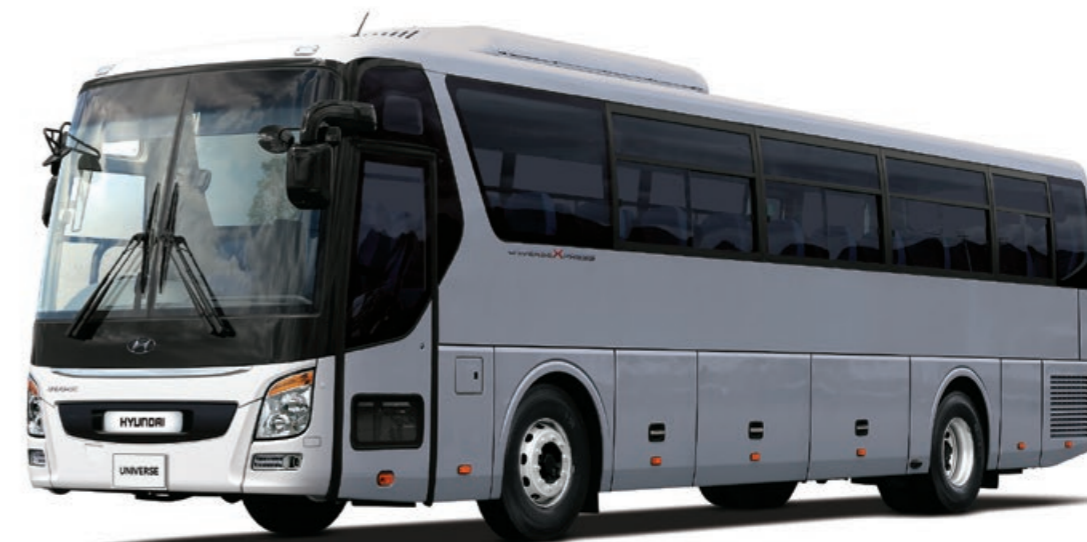
撮影用特別仕様車

短・中距離都市間路線や企業送迎バスに適した「BASIC仕様」を設定しました。経済性を重視し、スポイラーのないシンプルな外装としツープースガラスやスチールホイールを採用しました。