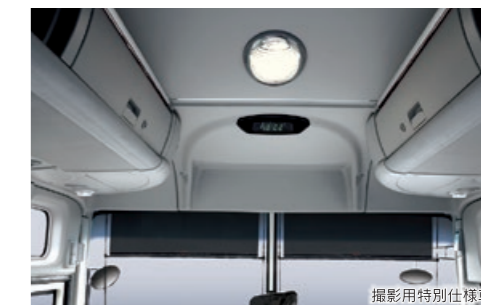
停留所案内・運賃表示器設置スペース

フロント上部に停留所案内、運賃表示器を設置するスペースを用意しました。設置が容易となるように設置部に補強を入れました。