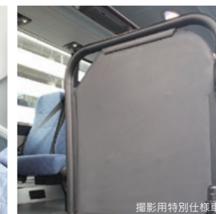
出入口仕切(標準パイプタイプ)